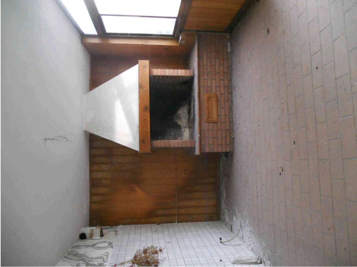
VISTA DELLA CUCINA DEL SUB 5