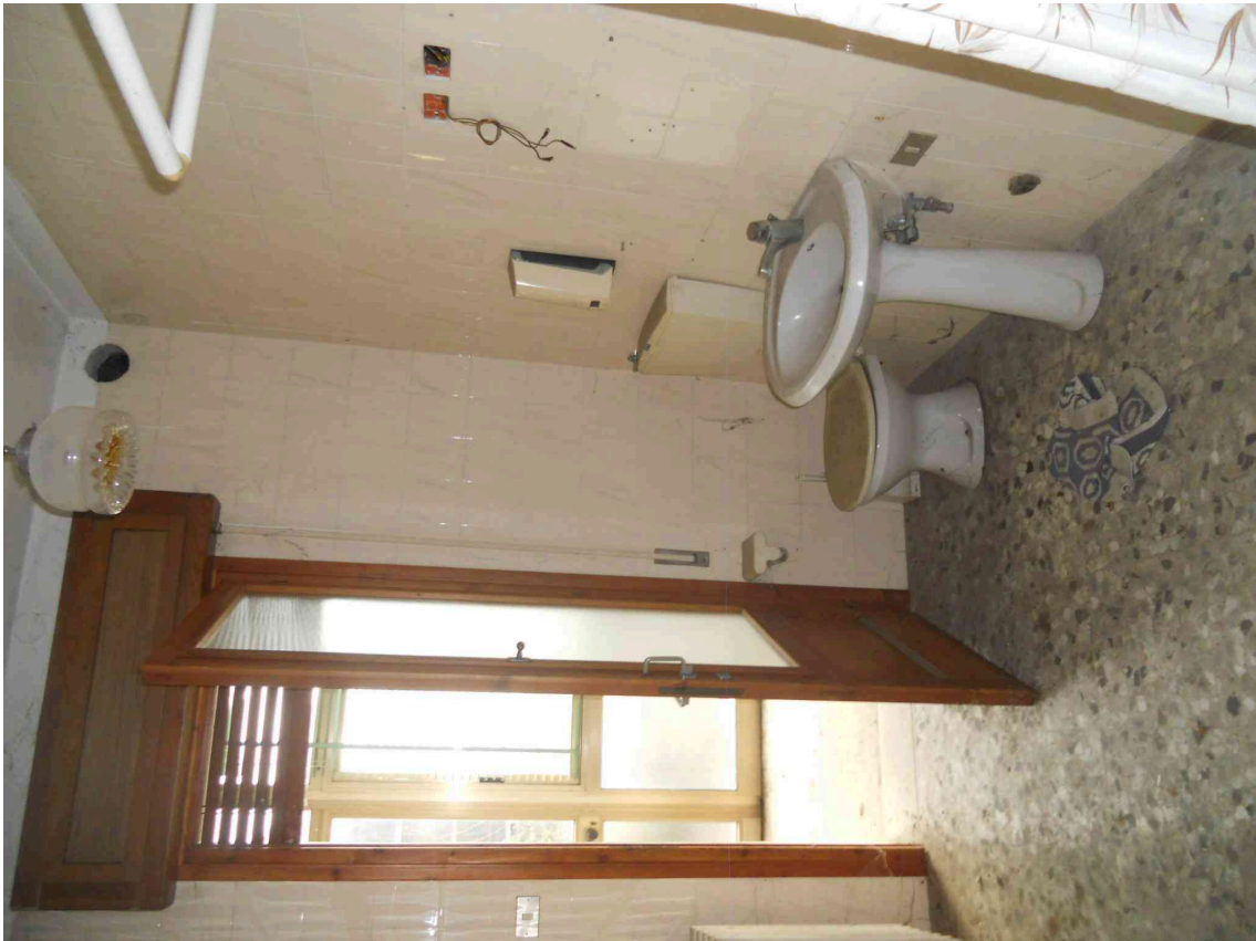
VISTA DI UN BAGNO DEL SUB 5