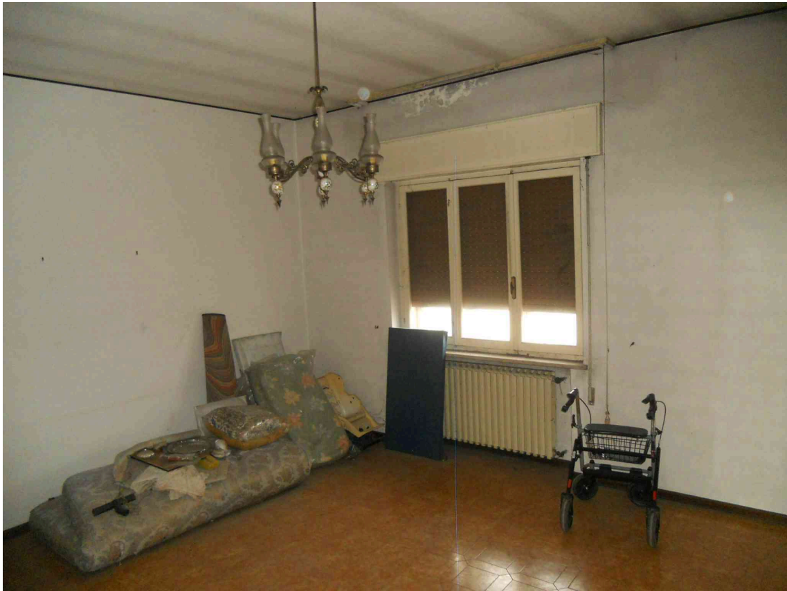
IL SOGGIORNO DEL SUB 10