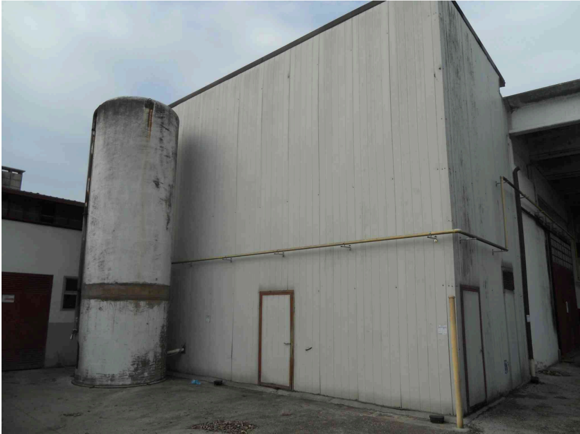
VISTA DEL DEPOSITO SILOS