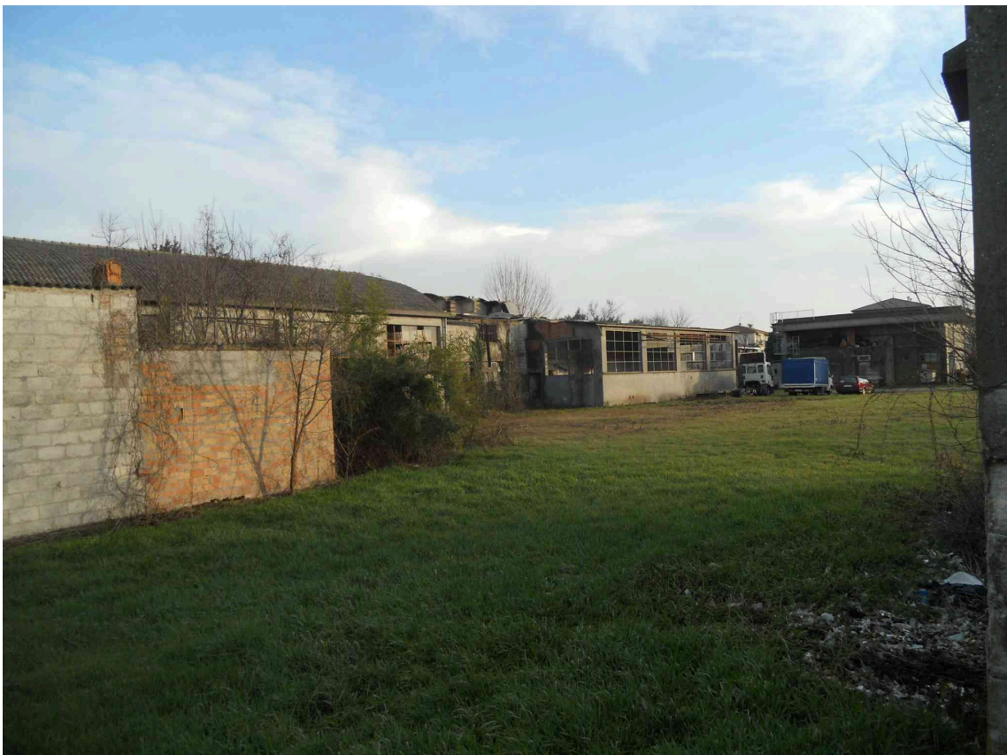
VISTA DEI MAPPALI 403 E 404