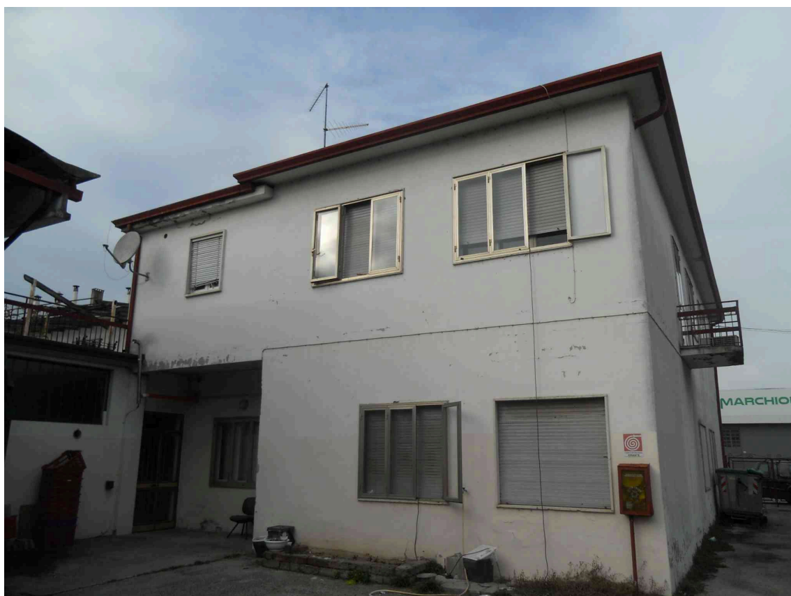
VISTA VERSO LA PALAZZINA CON GLI APPARTAMENTI AL P. 1°