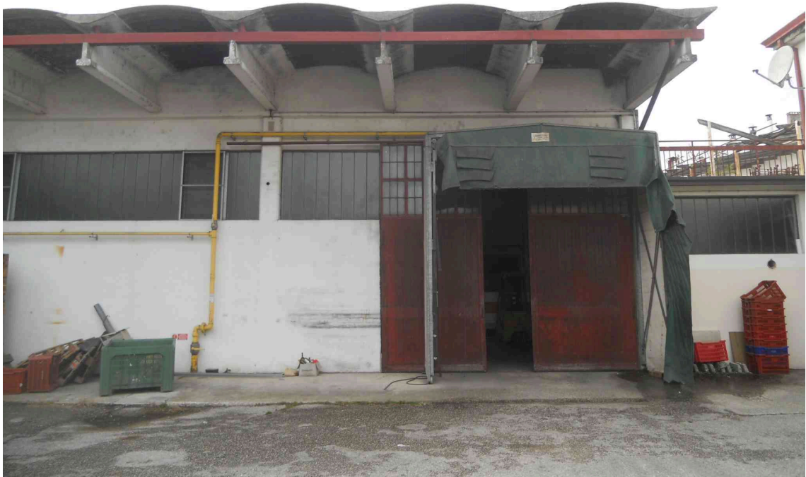
VISTA DALLA CORTE DEL SUB 8