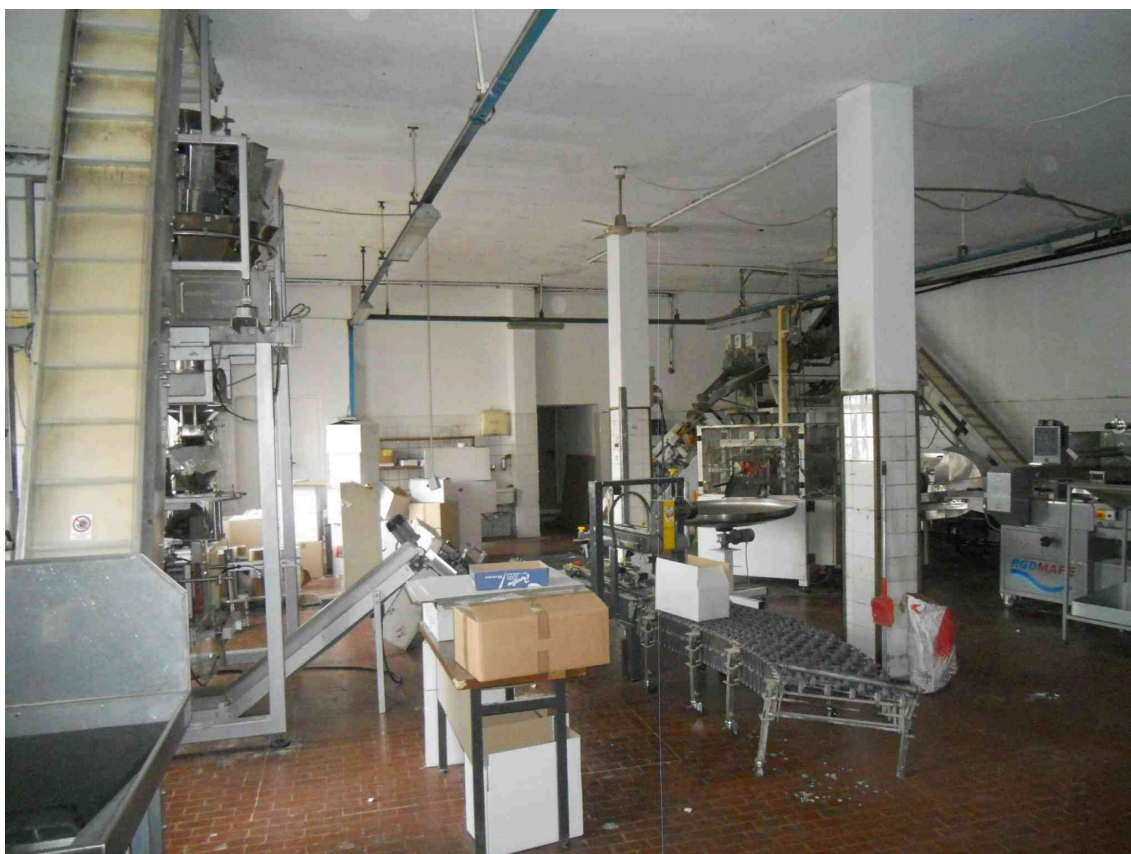
VISTA DEL LABORATORIO VERSO VIA PROLIN DEL PANIFICIO