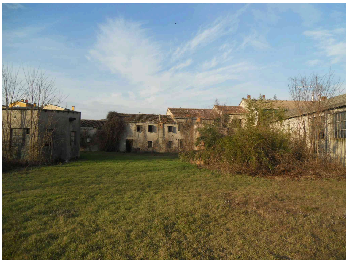
VISTA DA SUD DEGLI IMMOBILI A CORTINA