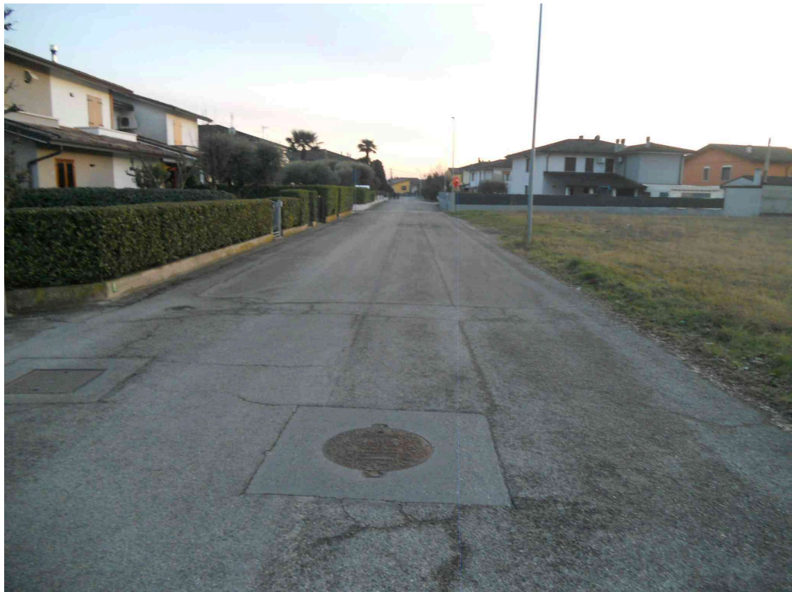
VISTA DI VIA MANZONI VERSO SUD