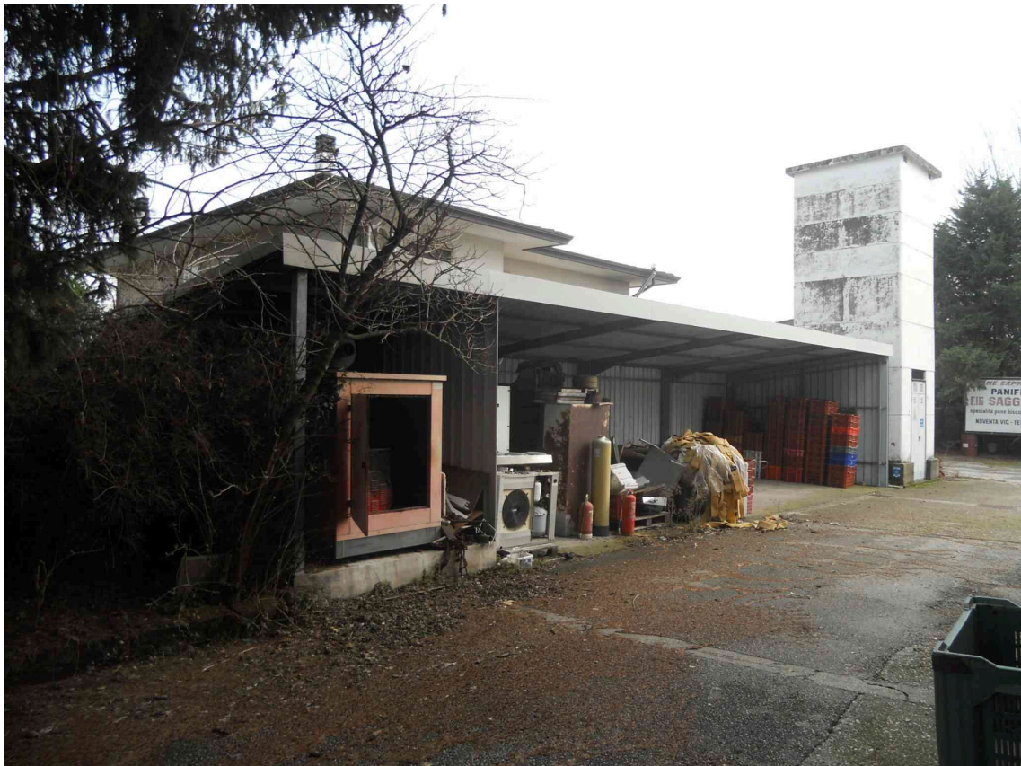
VISTA DELLA TETTOIA