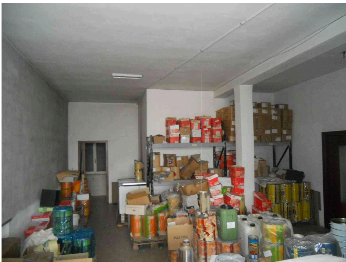
INTERNO DEL DEPOSITO MERCE PANIFICIO