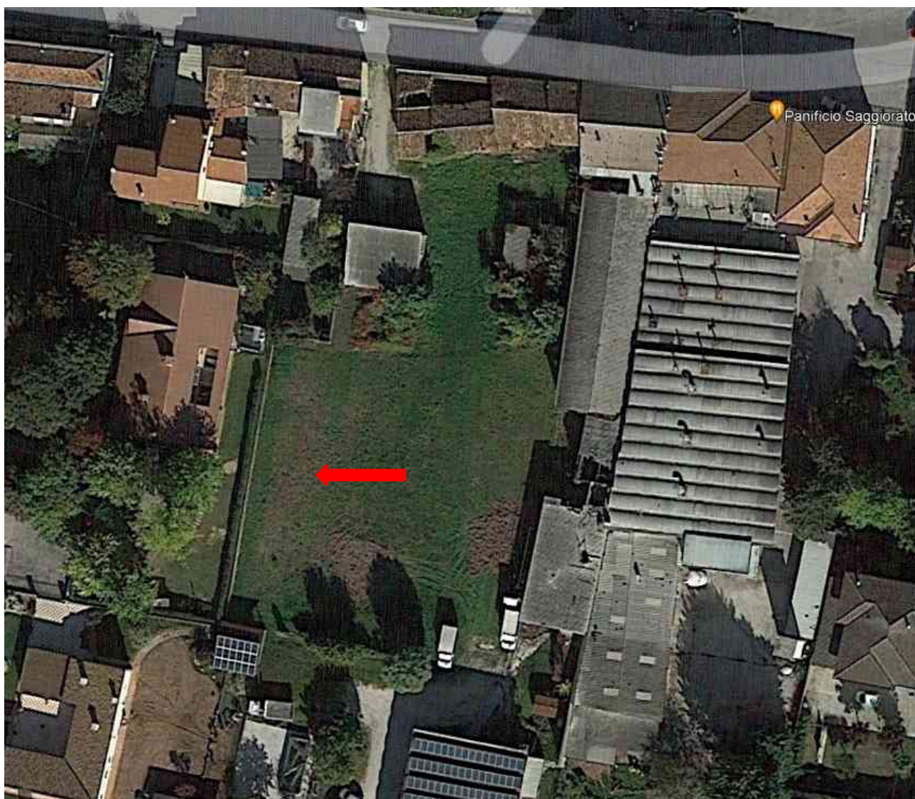
FOTO AEREA DEL MAPPALE 1283 CON LA CARROZZERIA ED IL PANIFICIO A DESTRA