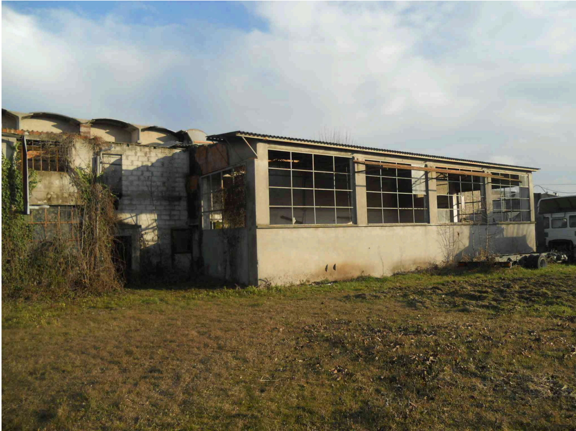
VISTA DEL SUB 3 DA OVEST