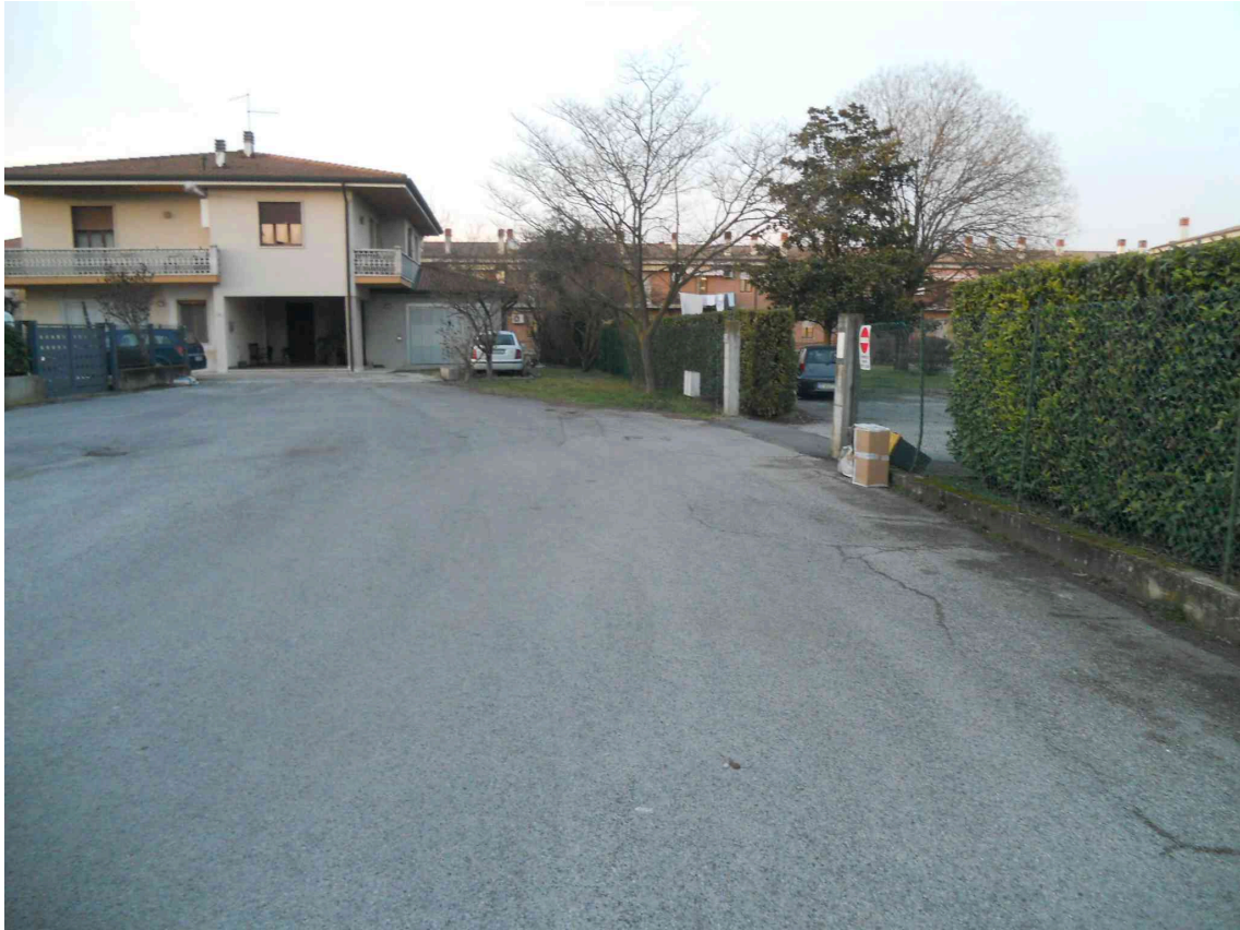
IL CUL DE SAC DI VIA PETRARCA