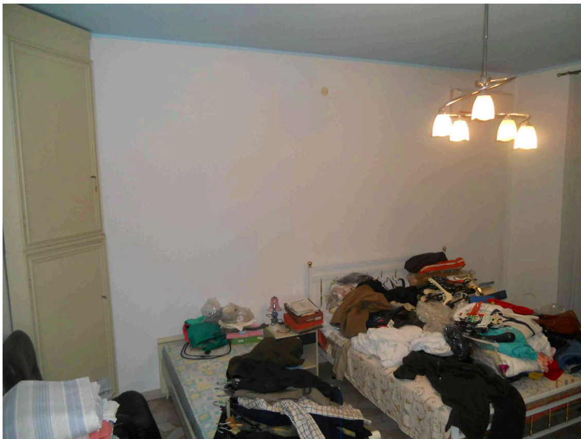
UNA CAMERA DEL SUB 10