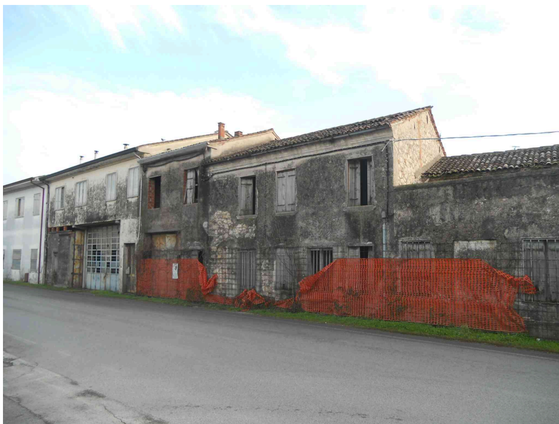
ALTRA VISTA DA VIA PROLIN