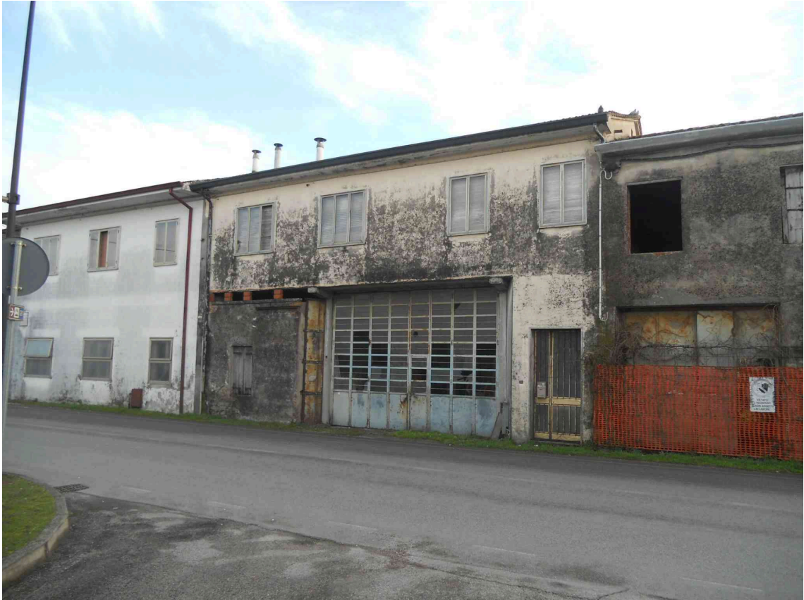
VISTA DA VIA PROLIN