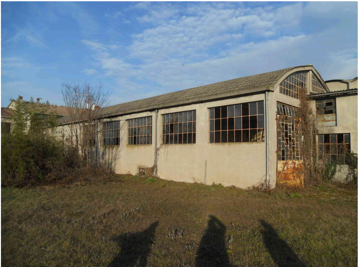
VISTA DEL SUB 4 DA OVEST