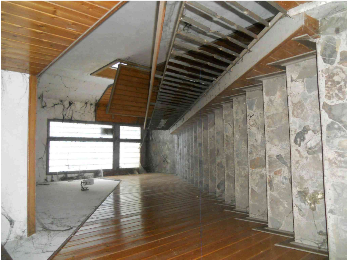
LA SCALA DI INGRESSO DEL SUB 5 DA VIA PROLIN