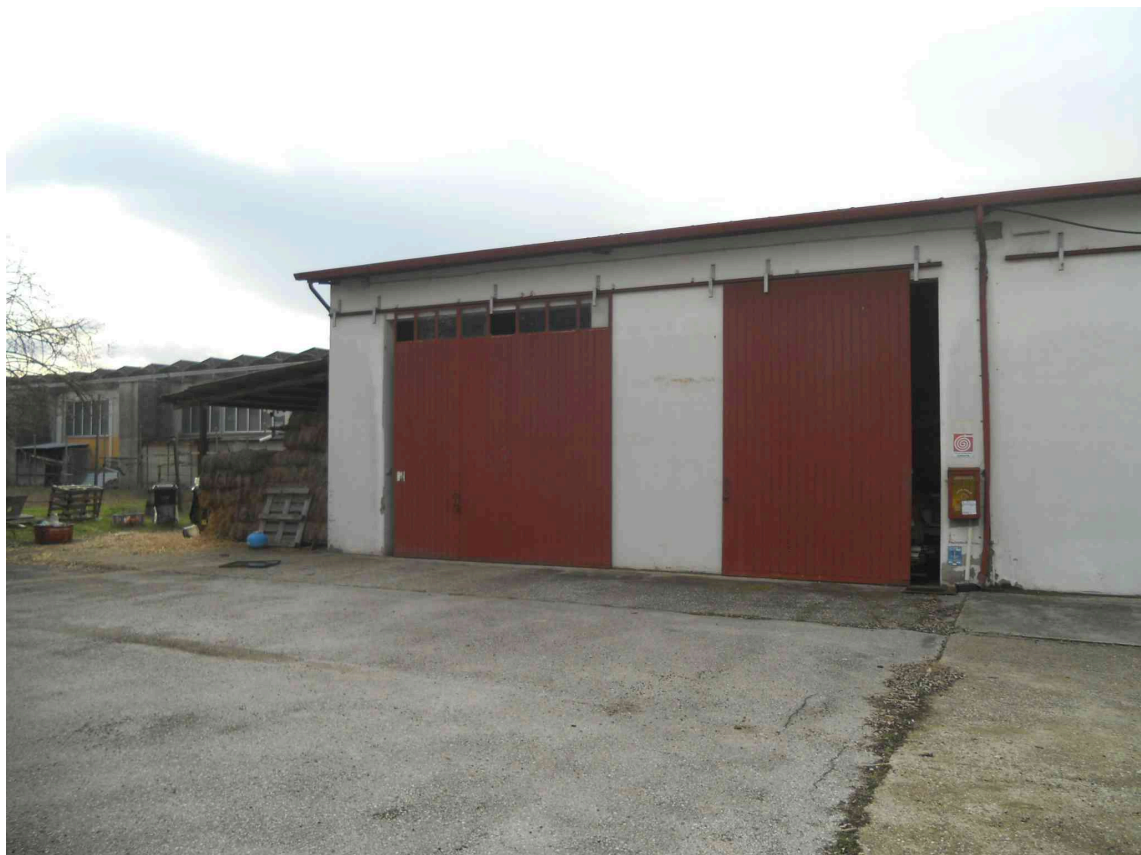
VISTA DEGLI INGRESSI DEI DEPOSITI