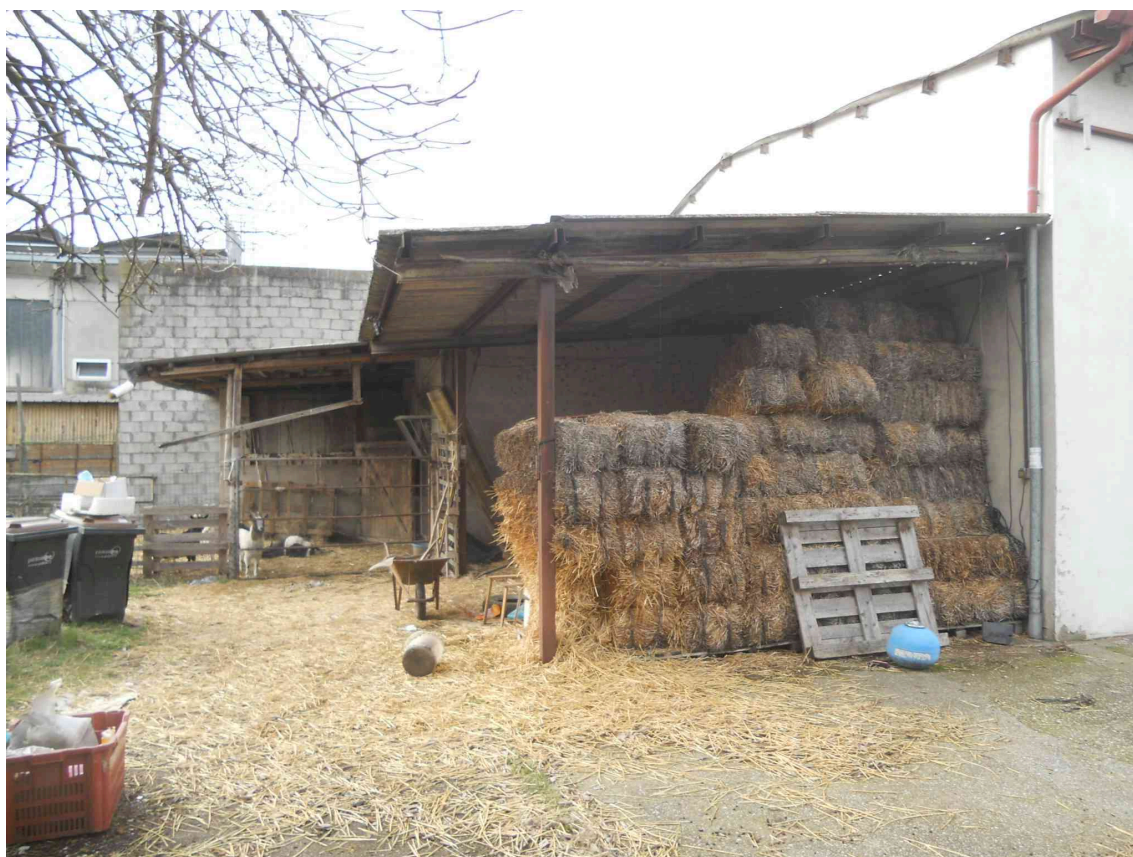
VISTA DELLE TETTOIE E DEI RIPOSTIGLI A SUD