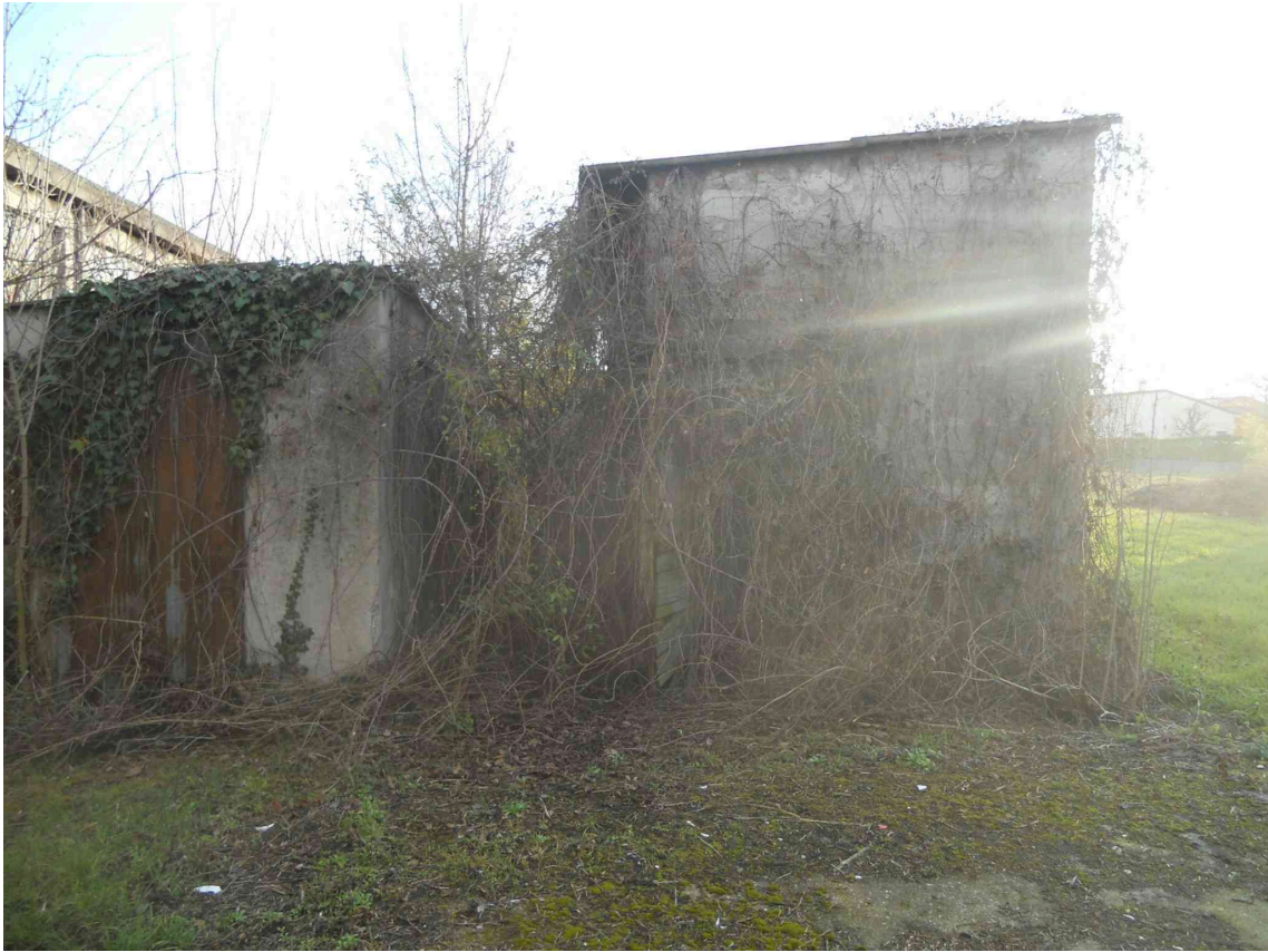
L'ACCESSORIO DEL MAPPALE 403