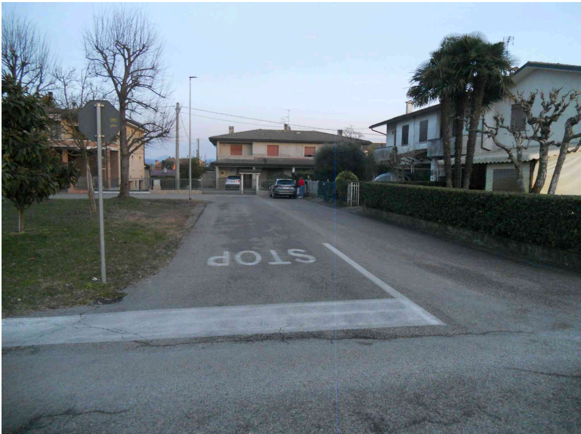
L'INNESTO DI VIA PETRARCA SU VIA MANZONI