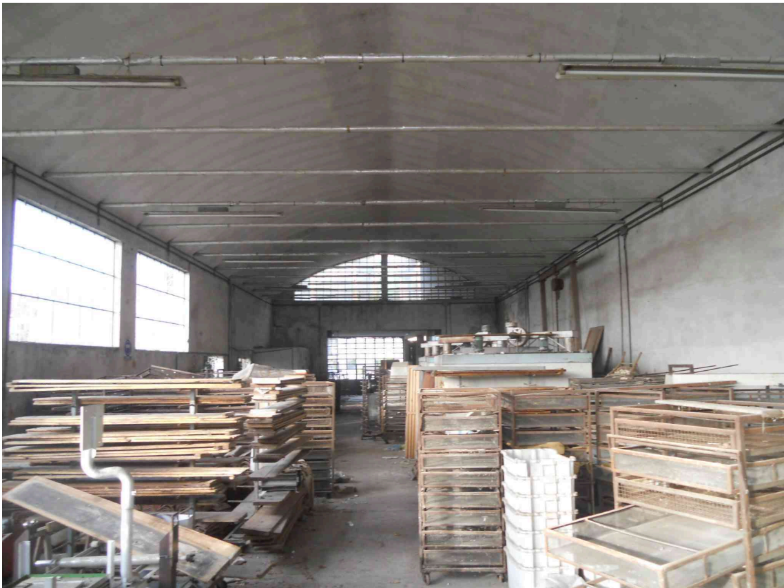
VISTA INTERNA DEL SUB 4