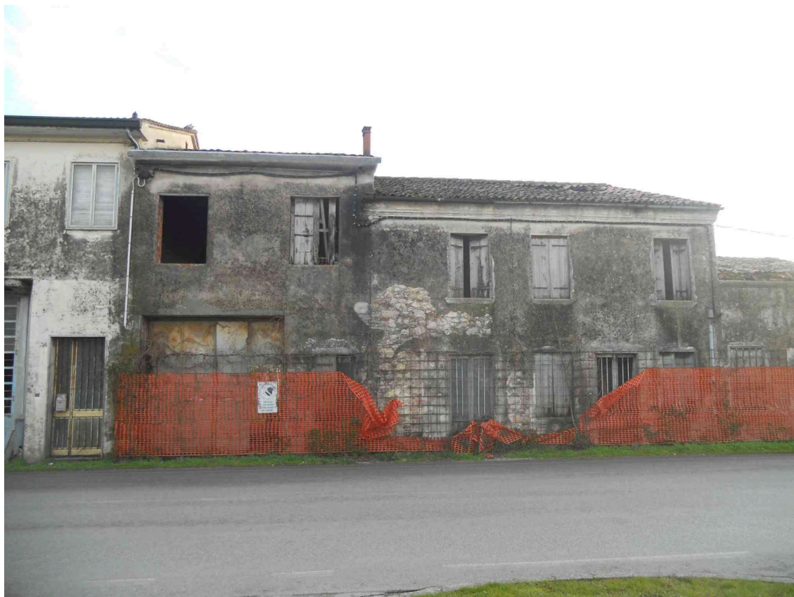
VISTA DA VIA PROLIN DEL LOTTO 4