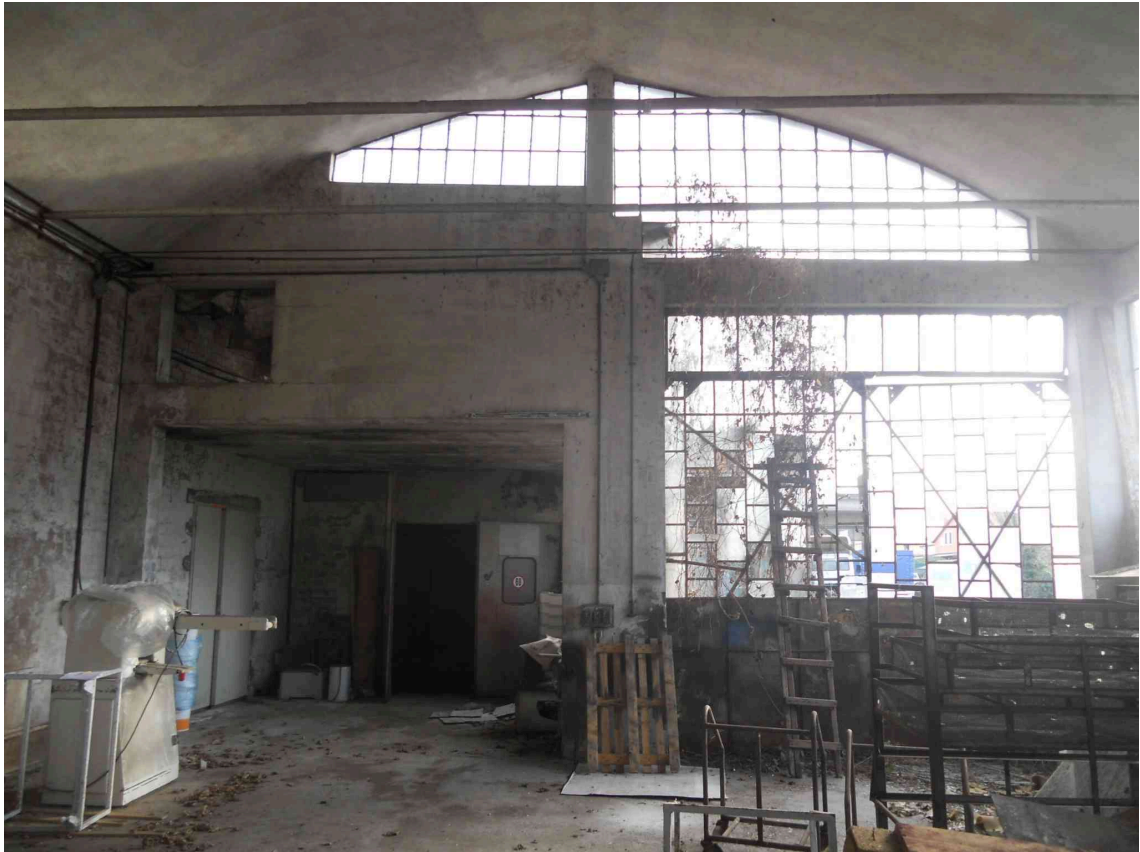
VISTA INTERNA DEL SUB 4 VERSO SUD