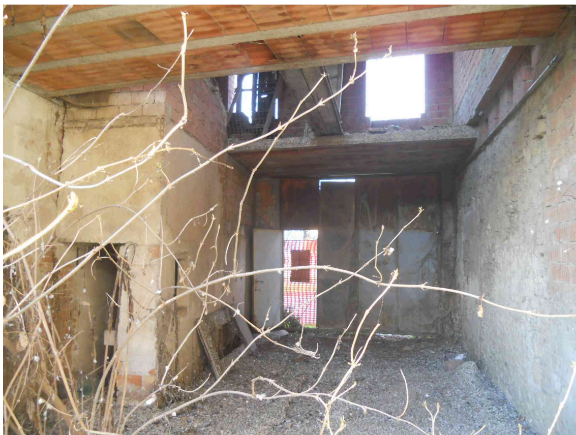
IL PASSAGGIO COPERTO DEL MAPPALE 407