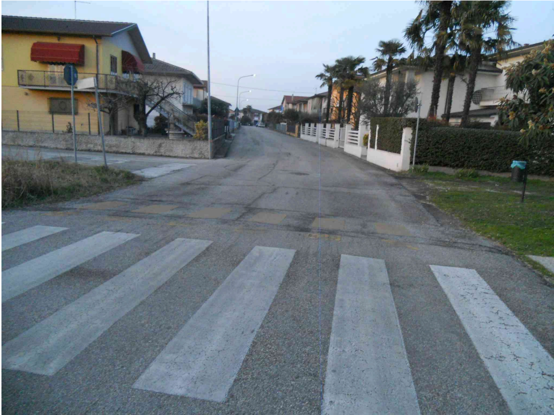
VISTA DI VIA MANZONI VERSO VIA PROLIN