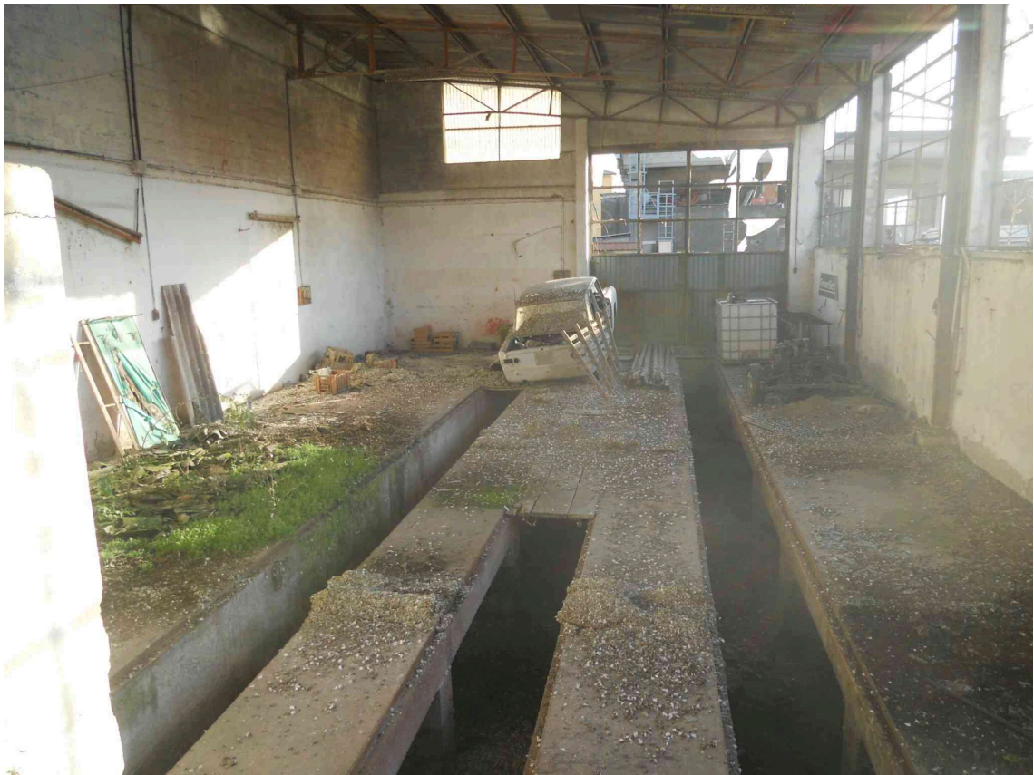
VISTA INTERNA DEL SUB 3