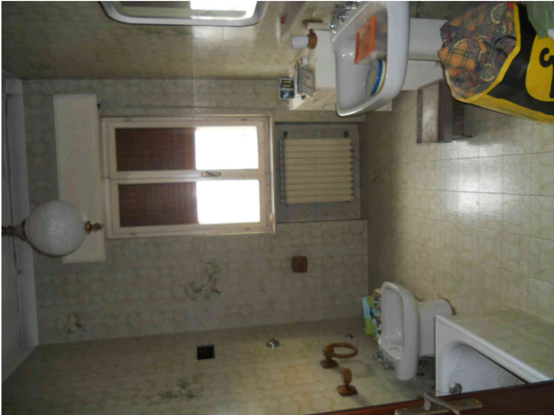
VISTA DI UN BAGNO DEL SUB 9