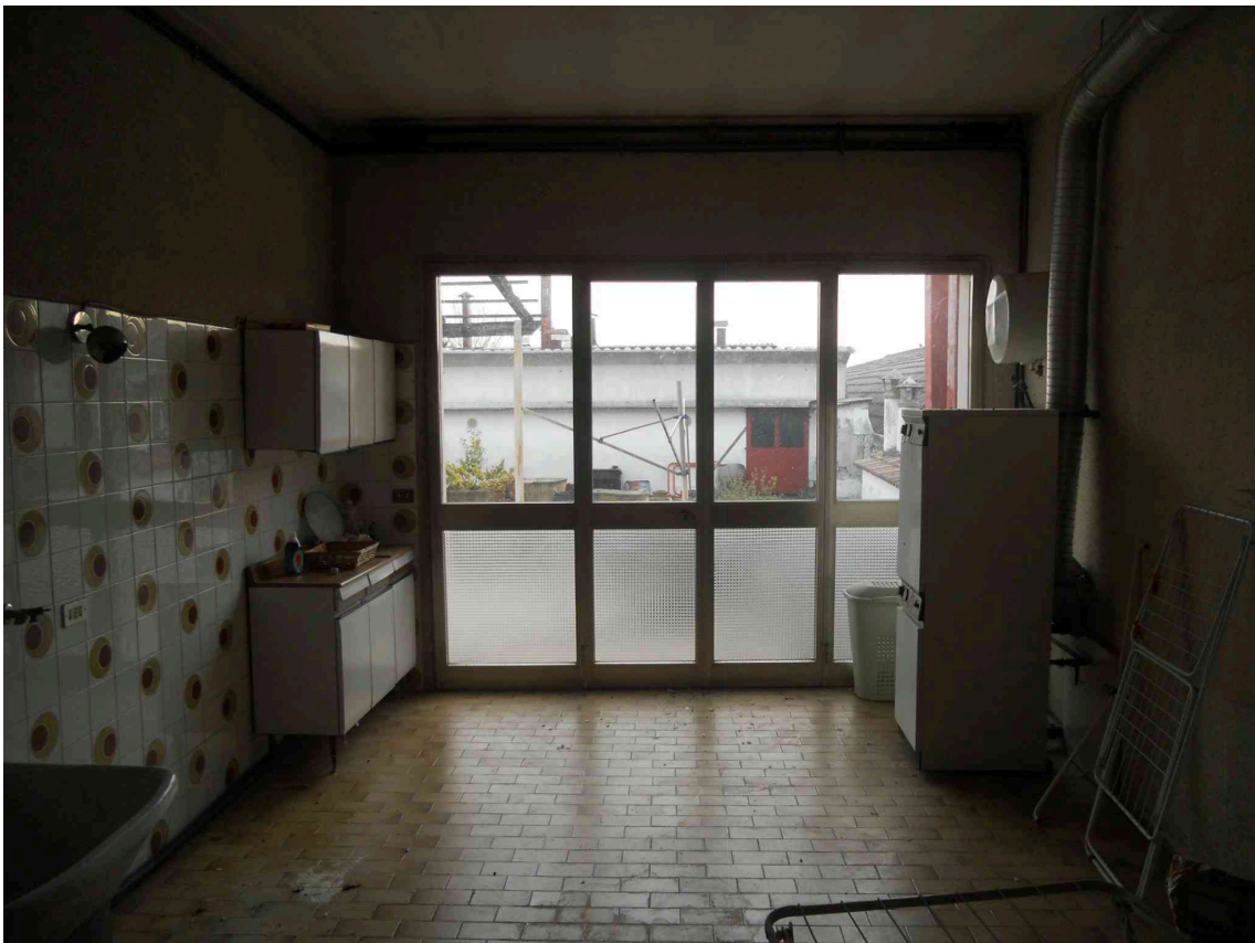
VISTA DEL RIPOSTIGLIO DEL SUB 10