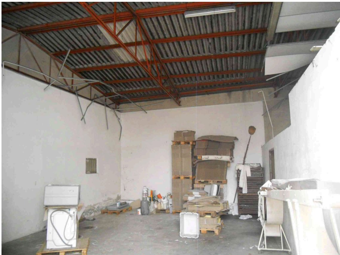
L'INTERNO DEI 2 DEPOSITI