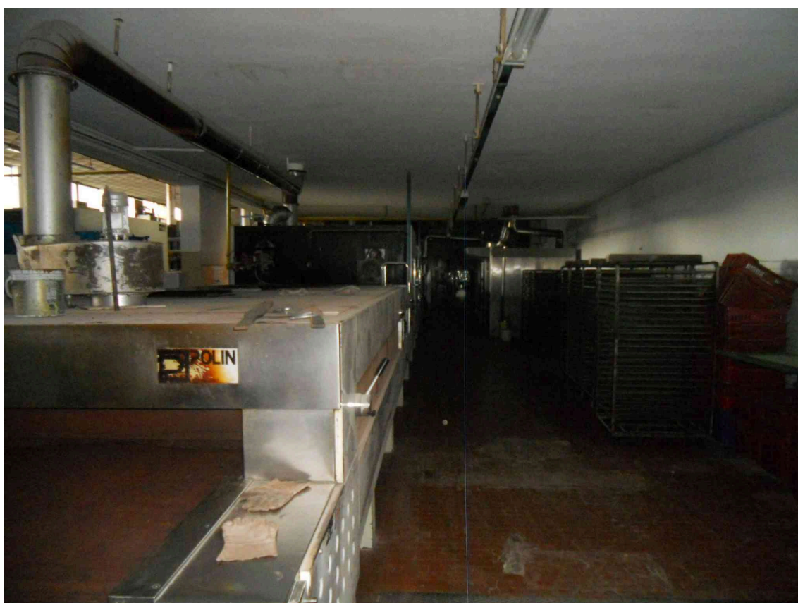
VISTA DEI FORNI NEL LABORATORIO DEL PANIFICIO