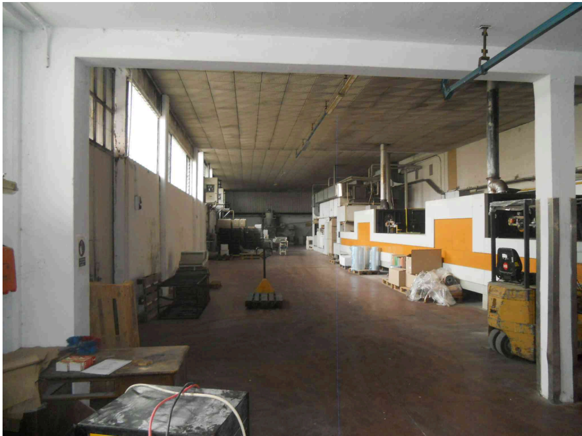
VISTA DEL LABORATORIO PARTE ALTA DEL PANIFICIO