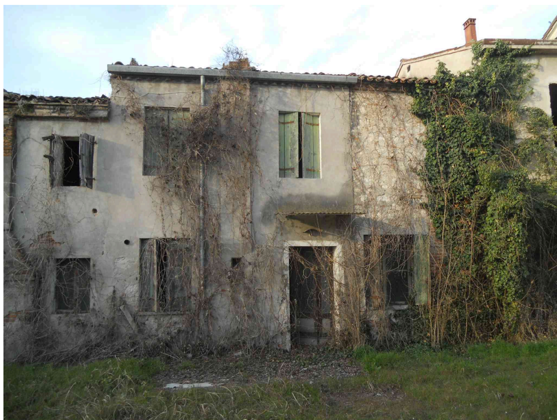
VISTA DALLA CORTE DEI SUB 1 E 2 MAPPALE 225