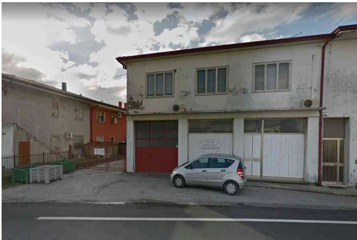
GLI INGRESSI DEI SUB 8, 9 E 10 SU VIA PROLIN