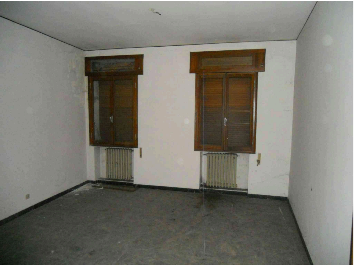
UNA STANZA DEL SUB 5 AL P.1°