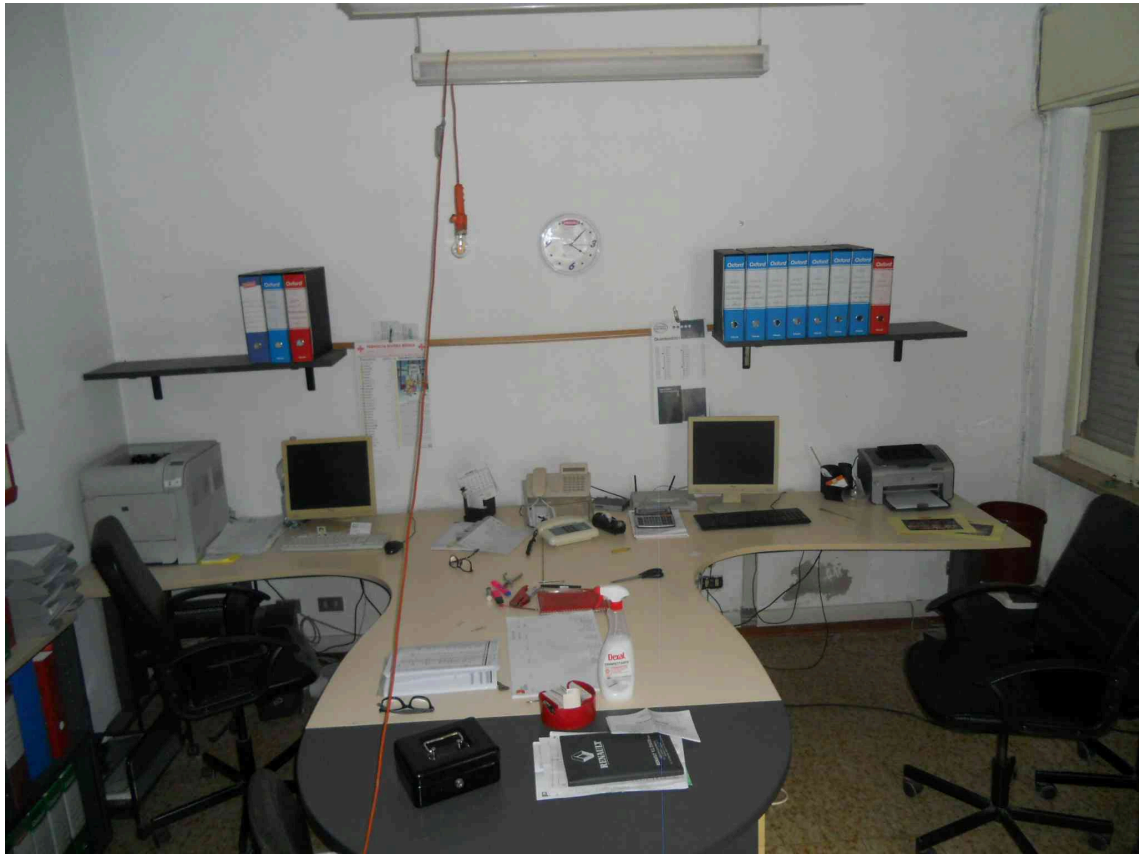
L'UFFICIO DEL PANIFICIO