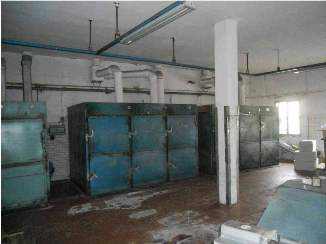
VISTA DEI FORNI NEL LABORATORIO DEL PANIFICIO