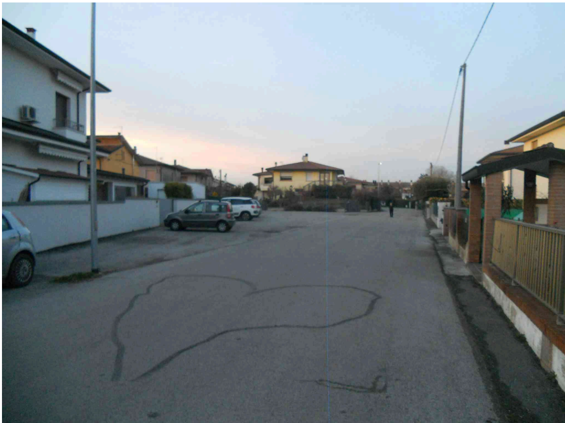
LO SLARGO AD USO PARCHEGGIO DI VIA PETRARCA