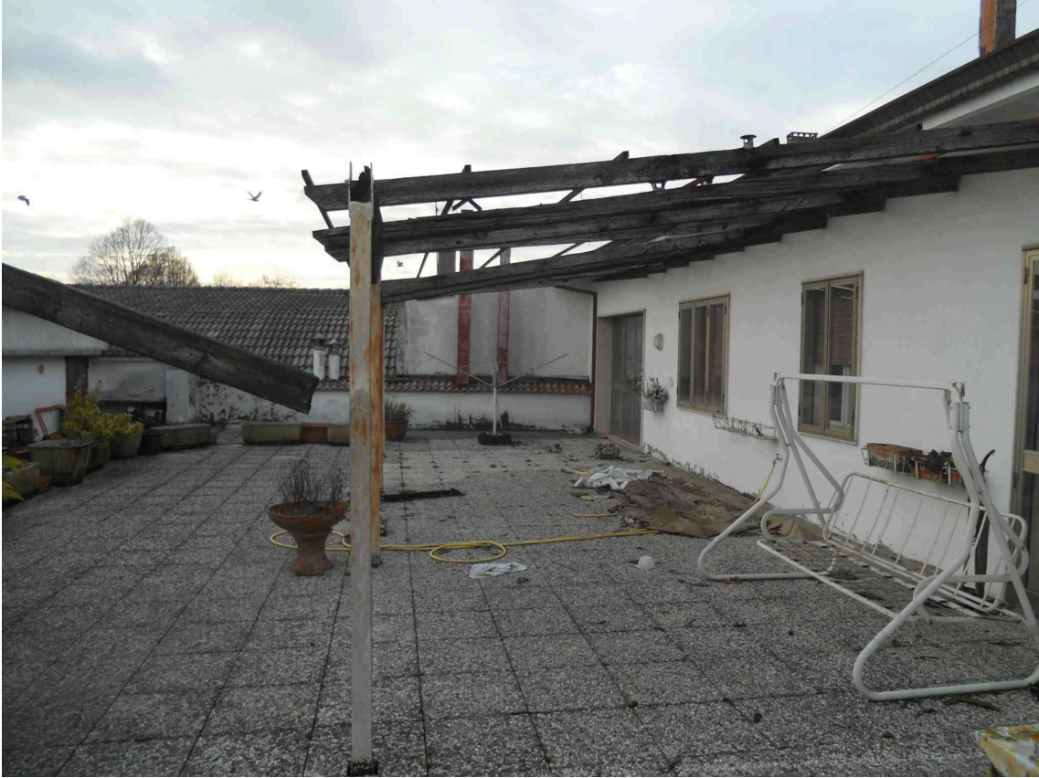
IL TERRAZZO COMUNE CUI SI AFFACCIANO I SUB 9 E 10