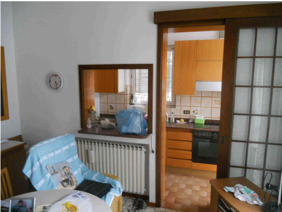
LA CUCINA AL P.1 DEL SUB 10