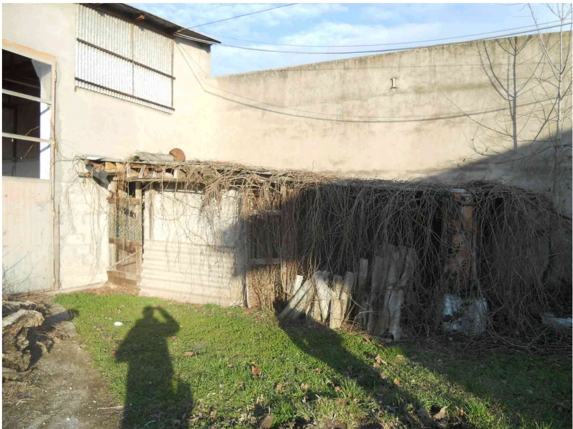
LA PARTE SUD DEL SUB 3