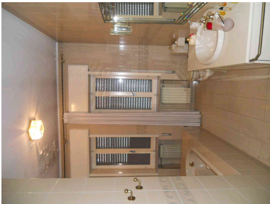
VISTA DI UN BAGNO DEL SUB 10