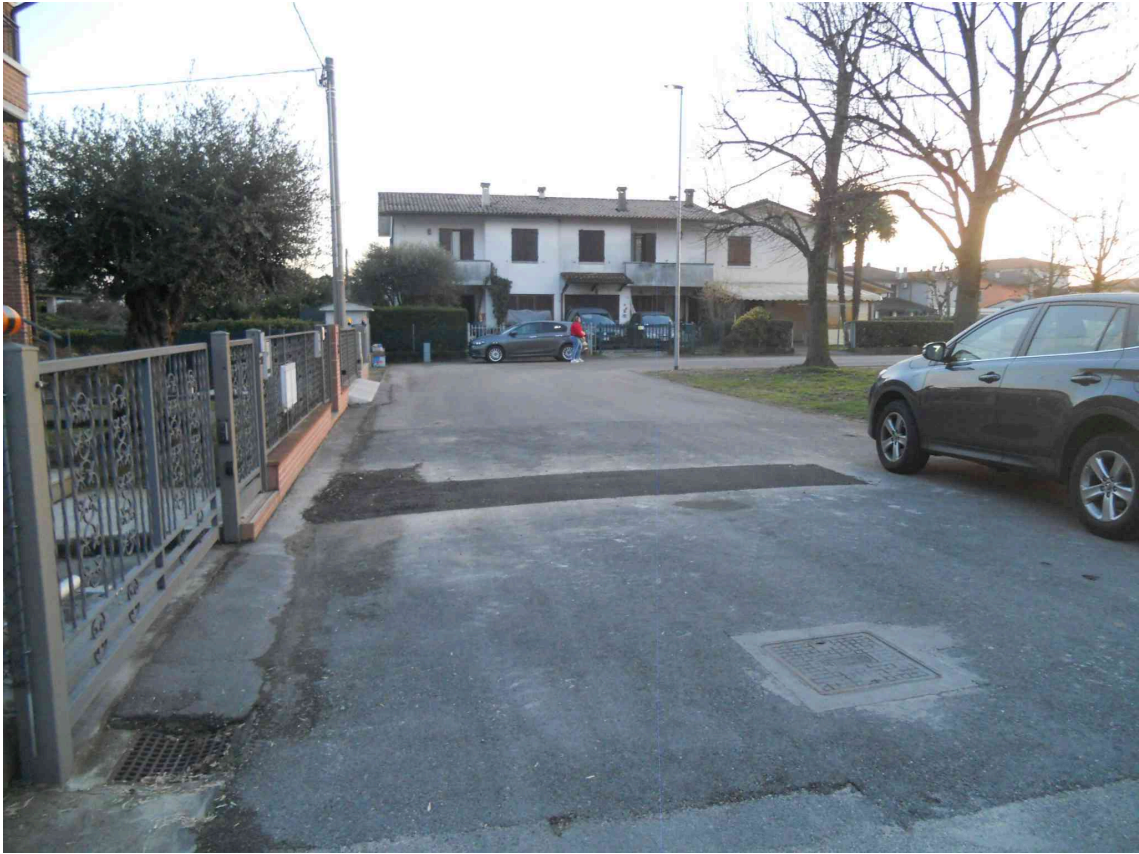
ALTRA VISTA DI VIA PETRARCA