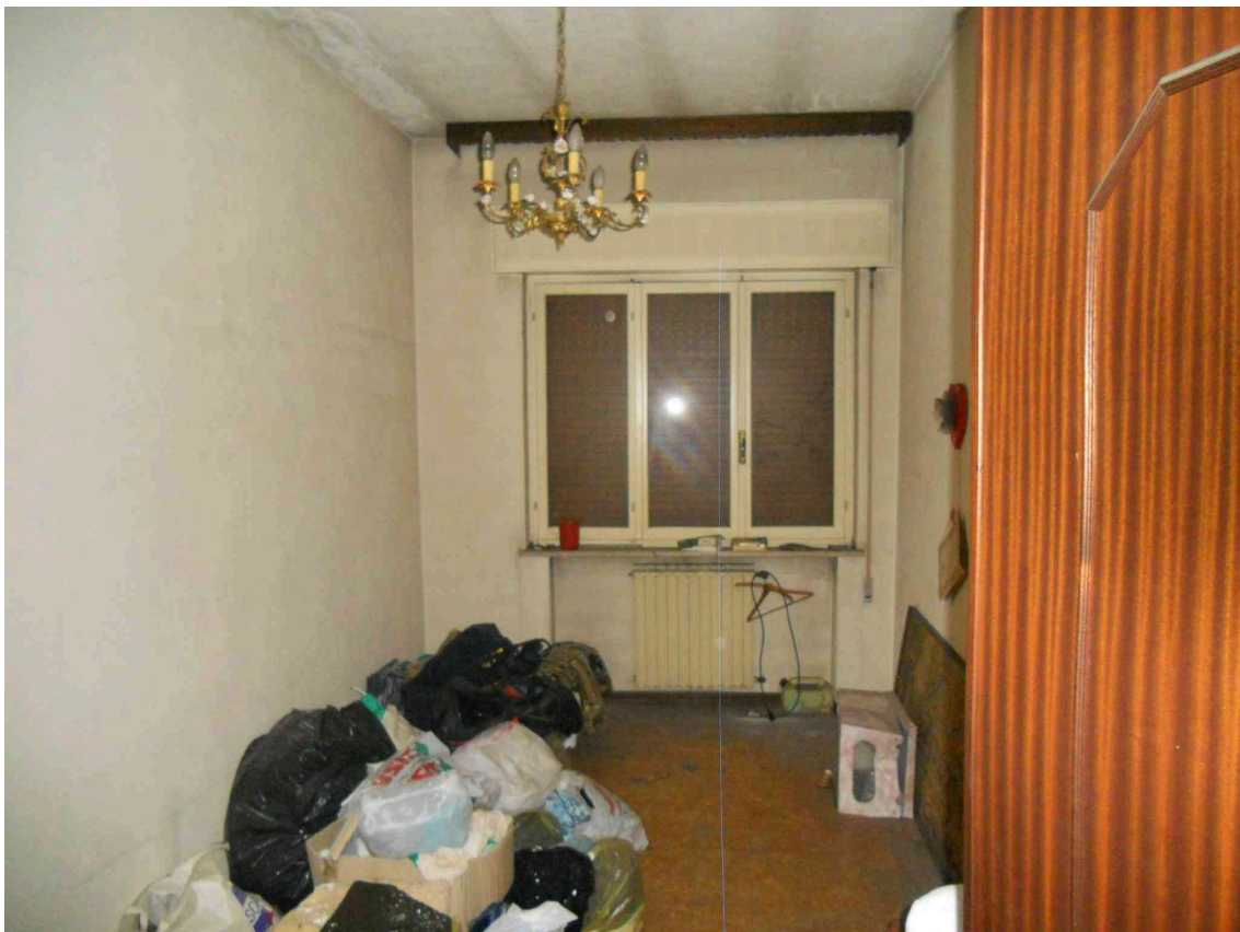
UNA STANZA DEL SUB 10