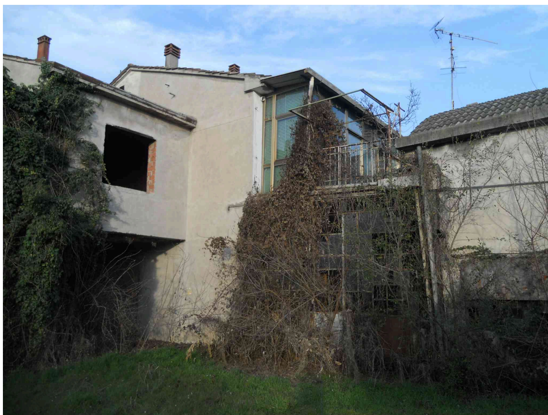
L'AREA DI PERTINENZA DEL MAPPALE 407